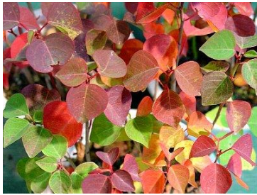
עלים של העץ ספיון השעווה המצטיין בצבעי שלכת מדהימים

רוב הצמחים בגינה נכנסים בעונת החורף לתקופה של תרדמת עד בוא האביב. אין זה אומר שלא צריך לטפל בגינה. גם בתקופה זו יש דברים נחוצים אותם צריך לבצע. הימים מתקצרים ואיתם זמני העבודה בגינה, רוב הצמחים הרב שנתיים נכנסים לתרדמה, אם אלו עצים נשירים שנשארים ערומים עד האביב או ירוקי עד שרמת הפעילות שלהם יורדת והם כמעט ולא פעילים.